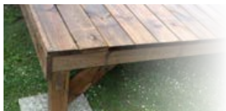
Plancher sur pilotis XL 5,40 x 8,15 m (44,01 m 2 )

Même configuration avec une terrasse allongée de 175 cm à l'avant soit 9,45 m 2 supplémentaire