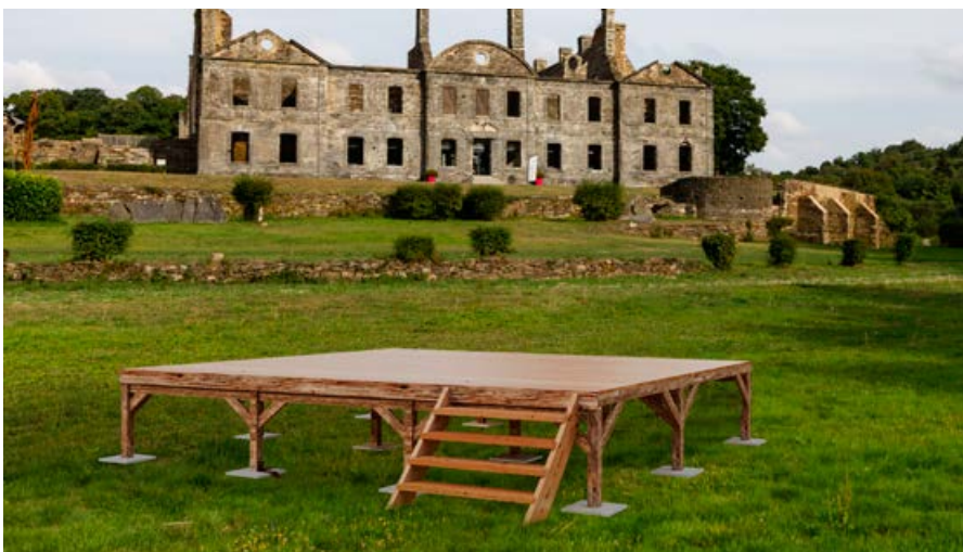
Altura de 4 escalones. Foto no contractual.

Para colocar sobre baldosas de grava. Suelo regulable que le permite adaptarse a la configuración de su terreno. Lona bajo el suelo para evitar el ascenso de corrientes de aire frío. Altura de 2 peldaños: 50 \text{ cm} máx. en la fachada sin terraza. Altura de 4 peldaños: 90 \text{ cm} máx. en la fachada con terraza. Superficie del suelo sin terraza: 536 \text{ cm} \times 476 \text{ cm} = 25,51 \text{ m}^2 . Superficie del suelo con terraza: 536 \text{ cm} \times 793 \text{ cm} = 42,50 \text{ m}^2 . Tratamiento en autoclave.